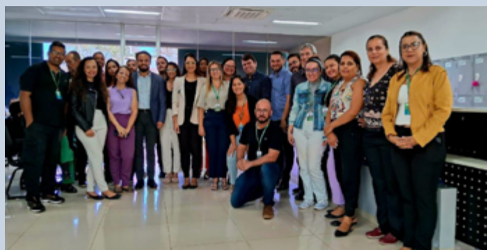
Equipe da SES e do Imed celebrando o fim da transição na Policlínica de Posse

eram, até então, geridas pelo Instituto CEM (Icem), que foi desqualificado como organização social de saúde, conforme resultado de processo instaurado pela Casa Civil, órgão da administração pública que tem a competência legal para qualificar ou desqualificar organizações sociais no estado.