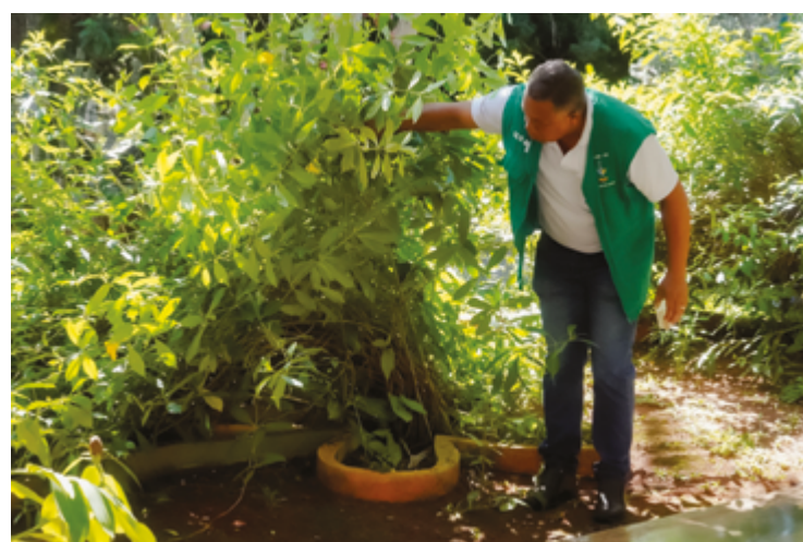
O ano de 2024 foi considerado o pior ano para a dengue em Goiás, com 397 mil notificações e 339 óbitos

época do ano é dentro das casas. É o vaso sanitário que não é utilizado, a piscina que não é tratada, a vasilha do animal que não é lavada semanalmente, a caixa d'água destampada. Então é importante lembrar que, mesmo sem chuvas, esses pequenos cuidados devem ser mantidos durante todo o ano. Mesmo com a redução de casos, precisamos nos man-