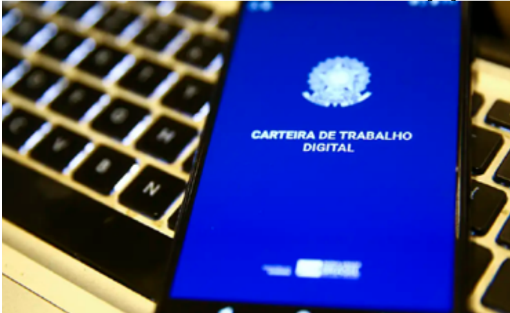
O balanço é do Cadastro Geral de Empregados e Desempregados (Novo Caged) divulgado nesta terça-feira (30) pelo Ministério do Trabalho e Emprego

Os cinco grandes grupos de atividades registraram saldos positivos em junho. O setor de serviços gerou 87.708, o de comércio 33.412 postos, a indústria 32.023 postos, a agropecuária 27.129 postos e o setor de construção gerou 21.449 postos. O destaque para o crescimento foi no setor de indústria, que registrou aumento de 165% em relação a junho do ano passado.