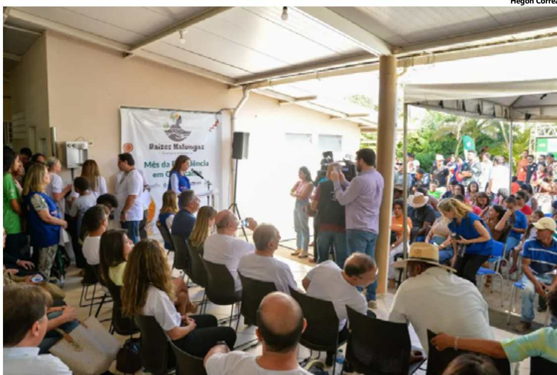
Primeira-dama Gracinha Caiado durante anúncio do novo restaurante do Bem em Cavalcante

Ainda no município, a primeira-dama anunciou a criação da Semana de Celebração e de Valorização da Cultura e da História das Comunidades Quilombolas. O decreto nº 10.510 que institui a iniciativa na primeira semana de maio foi publicado na última semana, no Diário Oficial do Estado de Goiás (DOE).