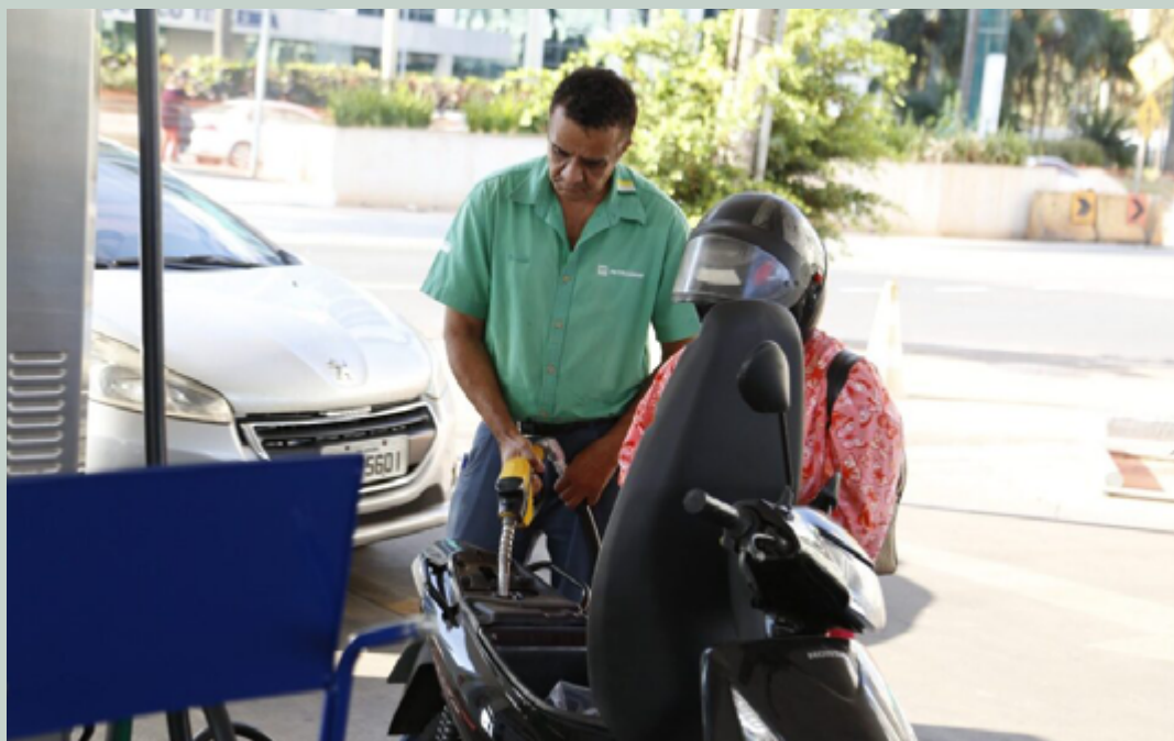
Com os resultados, Goiás atingiu a menor taxa de informalidade da toda a série histórica (35,9%)

admissões estabeleceu um recorde em sua respectiva série histórica, enquanto o saldo do emprego formal