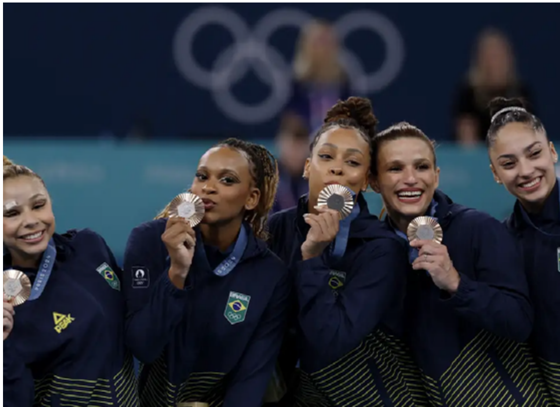
Flavia Saraiva, Rebeca Andrade, Lorrane Oliveira, Jade Barbosa e Julia Soares

A medalha de bronze em Paris 2024 representa um impulso significativo para a ginástica artística no Brasil. Este resultado histórico não só eleva o status do país no cenário internacional.