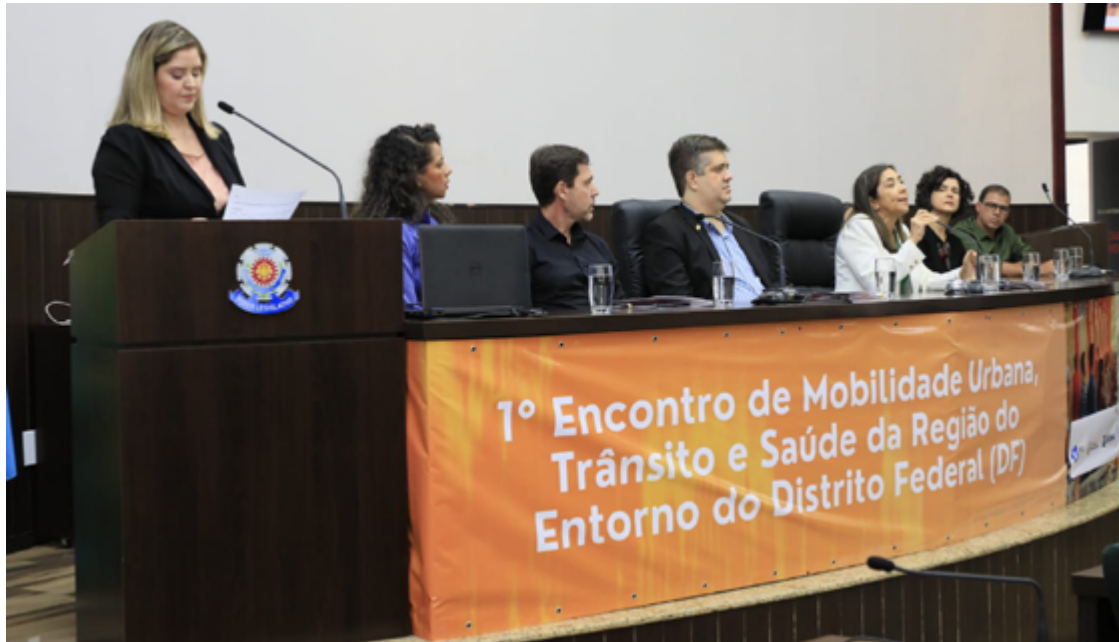
Participam do encontro especialistas, profissionais, gestores públicos e privados, bem como representantes da sociedade civil

De acordo com o subsecretário de Políticas para Cidades e Transporte da Secretaria-Geral de Governo, Miguel Angelo Pricinote, a iniciativa é direcionada especificamente para a área circundante ao Distrito Federal, no Brasil, abrangendo os municípios vizinhos goia-