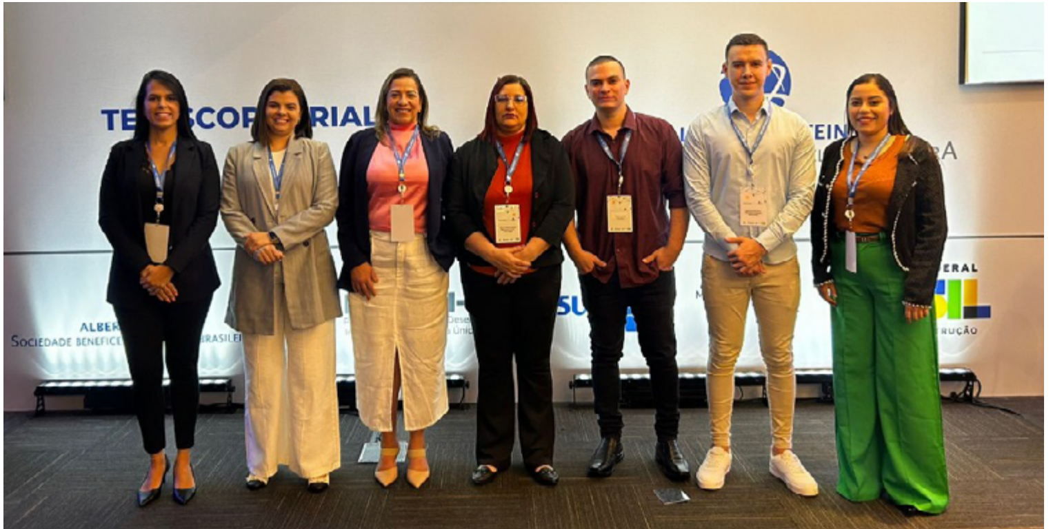
Profissionais do Hospital Estadual de Luziânia durante o evento do projeto Telescope Trial 2

Além da participação no treinamento e no alinhamento