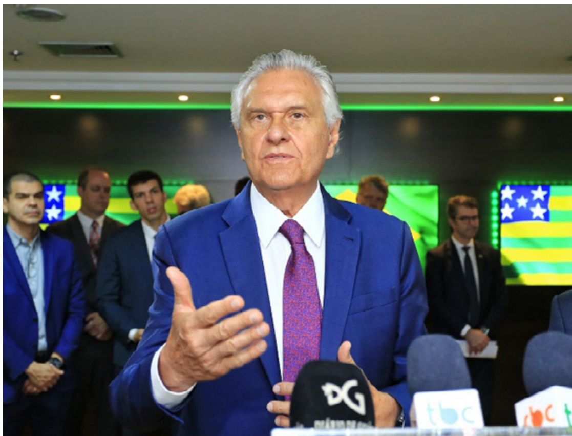
Ronaldo Caiado: incertezas quanto à lisura das eleições na Venezuela

As eleições na Venezuela foram disputadas pelo atual mandatário do país, Nicolás Maduro, que busca sua terceira reeleição, e pelo representante da oposição, Edmundo González, apoiado pela principal líder opositora, Maria Cori-