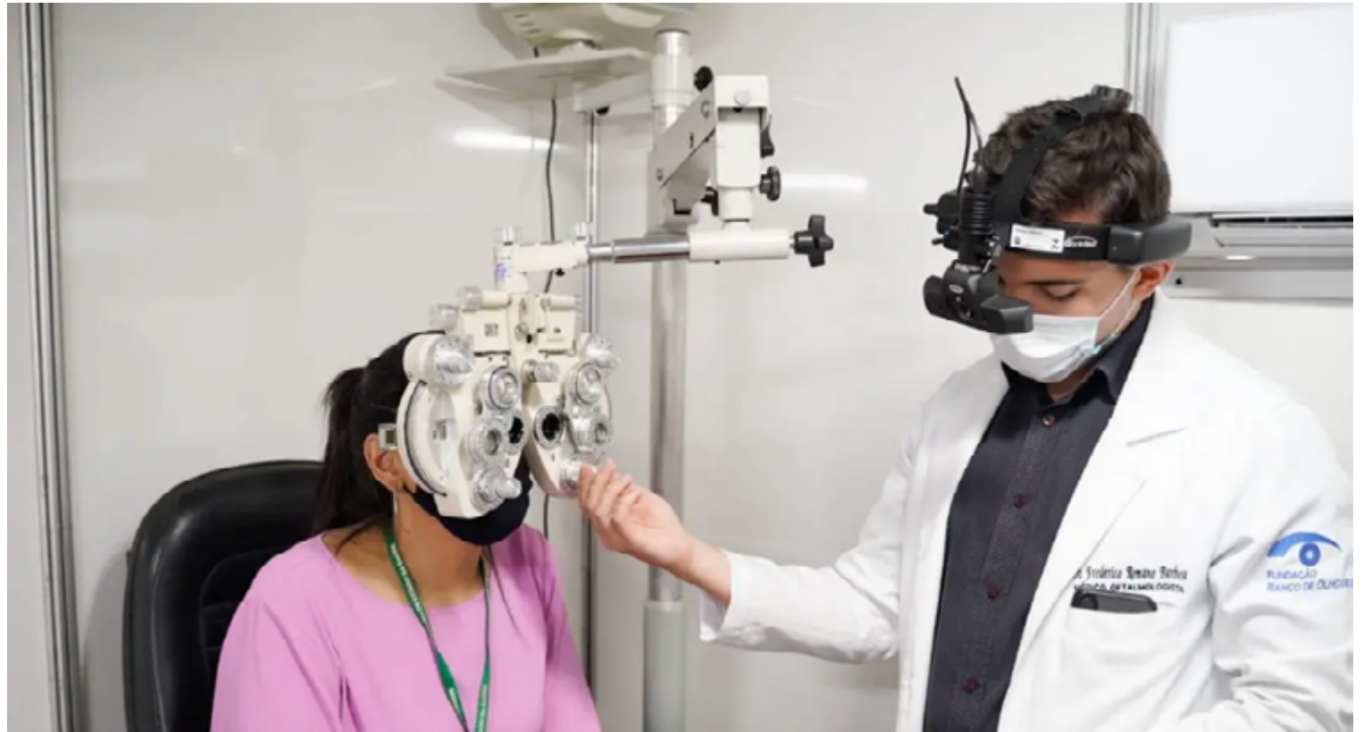
Equipe de oftalmologistas e enfermeiros fará o atendimento dos moradores da região

Foram montados consultórios para o atendimento nas instalações do evento, com previsão de realização de mais de cem avaliações,