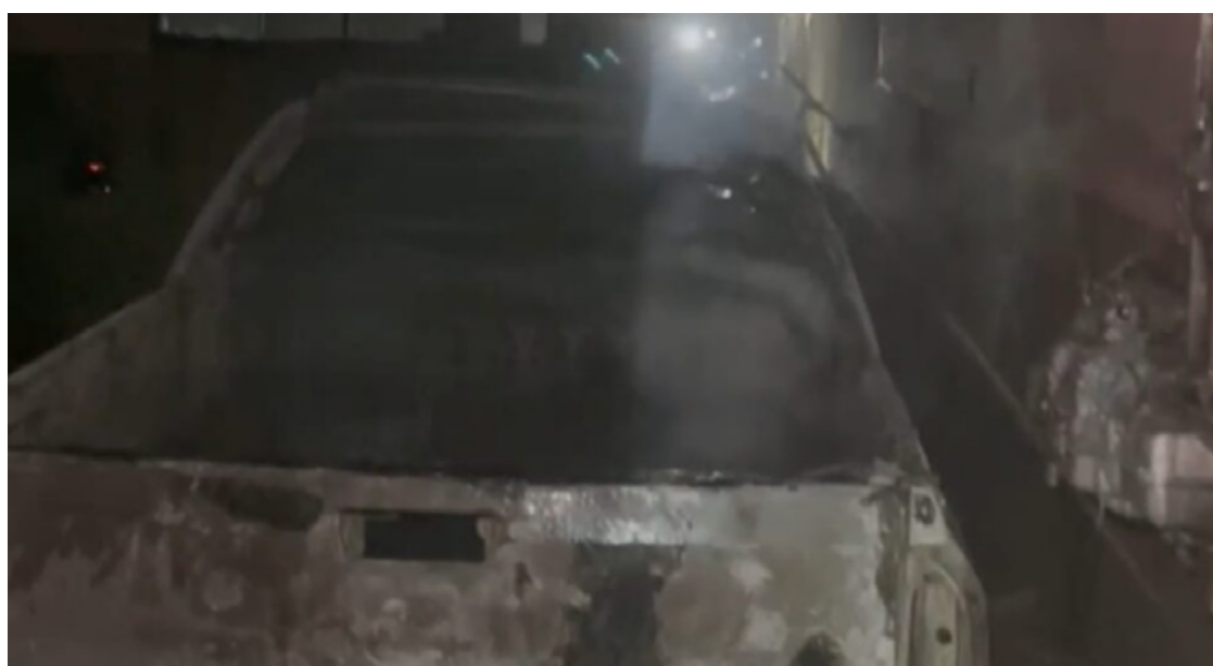
O veículo que originou o incêndio ficou completamente destruído pelas chamas.

A rápida resposta e a eficiência do Corpo de Bombeiros de Luziânia foram cruciais para evitar uma